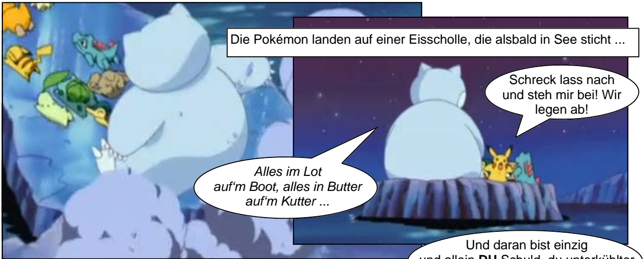
Die Pokémon landen auf einer Eisscholle, die alsbald in See sticht ...

Schreck lass nach und steh mir bei! Wir legen ab!